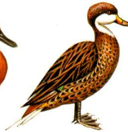
Pato gargantilla White-cheeked Pintail Anas bahamensis (35 cm)