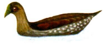
Pollona pintada Spot-flanked Gallinule Gallinula melanops (22 cm)