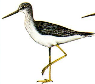
Pitotoy grande Greater Yellowlegs Tringa melanoleuca (28 cm)