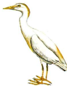
Garcita buyera Cattle Egret Bubulcus ibis (35 cm)