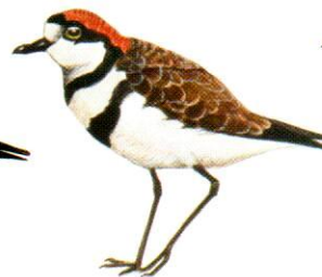
Chorlito doble collar Two-banded Plover Charadrius falklandicus (16 cm)