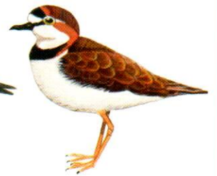
Chorlito de collar Collared Plover Charadrius collaris (14 cm)