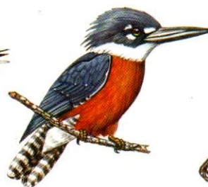
Martín pescador grande Ringed Kingfisher Ceryle torquata (38 cm)