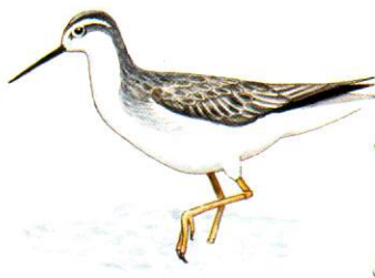
Falaropo común Wilson's Phalarope Phalaropus tricolor (20 cm)