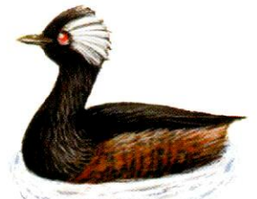
Macá común White-tufted Grebe Podiceps rolland (20 cm)