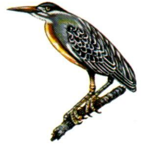
Garcita azulada Striated Heron Butorides striatus (38 cm)