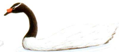
Cisne cuello negro Black-necked Swan Cygnus melancoryphus (80 cm)