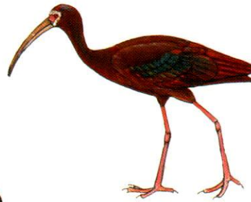
Cuervillo de cañada White-faced Ibis Plegadis chihi (45 cm)