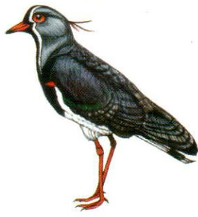
Tero común Southern Lapwing Vanellus chilensis (31 cm)