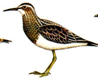
Playerito pectoral Pectoral Sandpiper Calidris melanotos (18 cm)