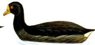
Gallareta chica White-winged Coot Fulica leucoptera (30 cm)