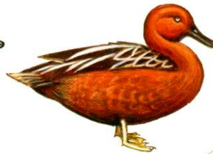
Pato colorado Cinnamon Teal Anas cyanoptera (38 cm)