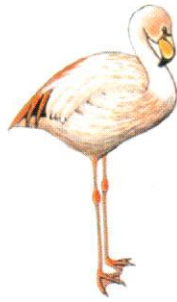
Parina chica Puna Flamingo Phoenicoparrus jamesi (62 cm)