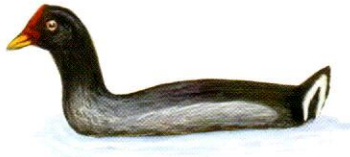
Gallareta escudete rojo Red-fronted Coot Fulica rufifrons (32 cm)