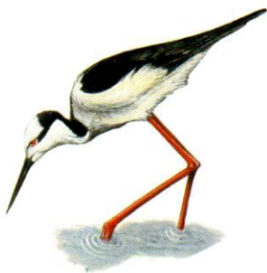
Tero real South American Stilt Himantopus mexicanus (35 cm)