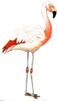
Flamenco común Chilean Flamingo Phoenicopterus chilensis (70 cm)