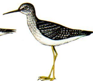
Pitotoy chico Lesser Yellowlegs Tringa flavipes (23 cm)