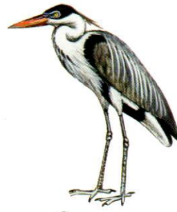
Garza mora White-necked Heron Ardea cocoi (75 cm)