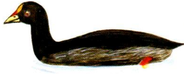
Gallareta ligas rojas Red-gartered Coot Fulica armillata (35 cm)