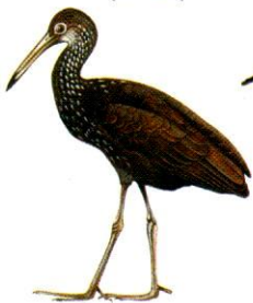
Carau Limpkin Aramus guarauna (54 cm)