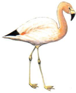
Flamenco andino Andean Flamingo Phoenicoparrus andinus (75 cm)