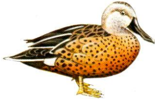
Pato cuchara Red Shoveler Anas platalea (35 cm)