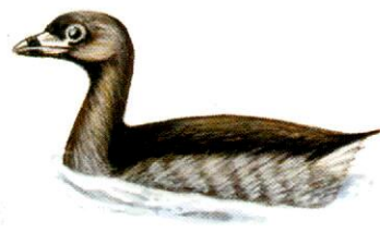
Macá pico grueso Pied-billed Grebe Podilymbus podiceps (27 cm)