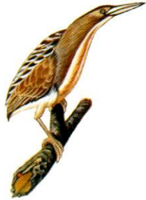
Mirasoal común Stripe-backed Bittern Ixobrychus involucris (31 cm)