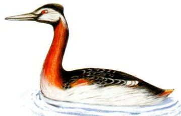
Macá grande Great Grebe Podiceps major (38 cm)