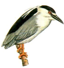
Garza bruja Black-crowned Night-Heron Nycticorax nycticorax (50 cm)