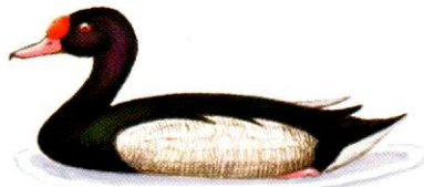
Pato picazo Rosy-billed Pochard Netta peposaca (40 cm)