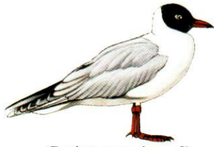
Gaviota capucho café Brown-hooded Gull Larus maculipennis (35 cm)