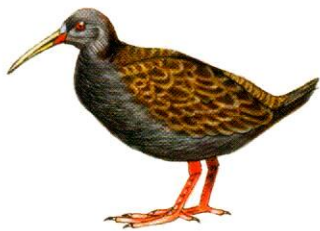
Gallineta común Plumbeous Rail Pardirallus sanguinolentus (31 cm)