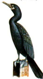
Biguá Neotropic Cormorant Phalacrocorax olivaceus (60 cm)