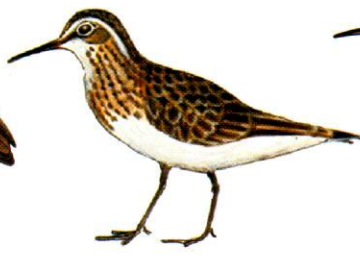
Playerito rabadilla blanca White-rumped Sandpiper Calidris fuscicollis (15 cm)