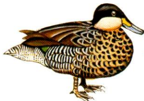
Pato capuchino Silver Teal Anas versicolor (28 cm)