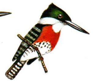
Martín pescador chico Green Kingfisher Chloroceryle americana (15 cm)