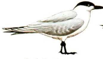
Gaviotín pico grueso Gull-billed Tern Sterna nilotica (32 cm)