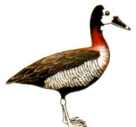
Sirirí pampa White-faced Tree-Duck Dendrocygna viduata (35 cm)