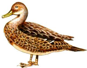
Pato maicero Brown Pintail Anas georgica (40 cm)