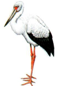
Cigüeña común Maguari Stork Ciconia maguari (85 cm)