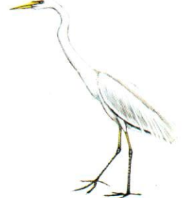
Garza blanca Great Egret Egretta alba (65 cm)