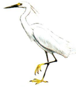
Garcita blanca Snowy Egret Egretta thula (40 cm)